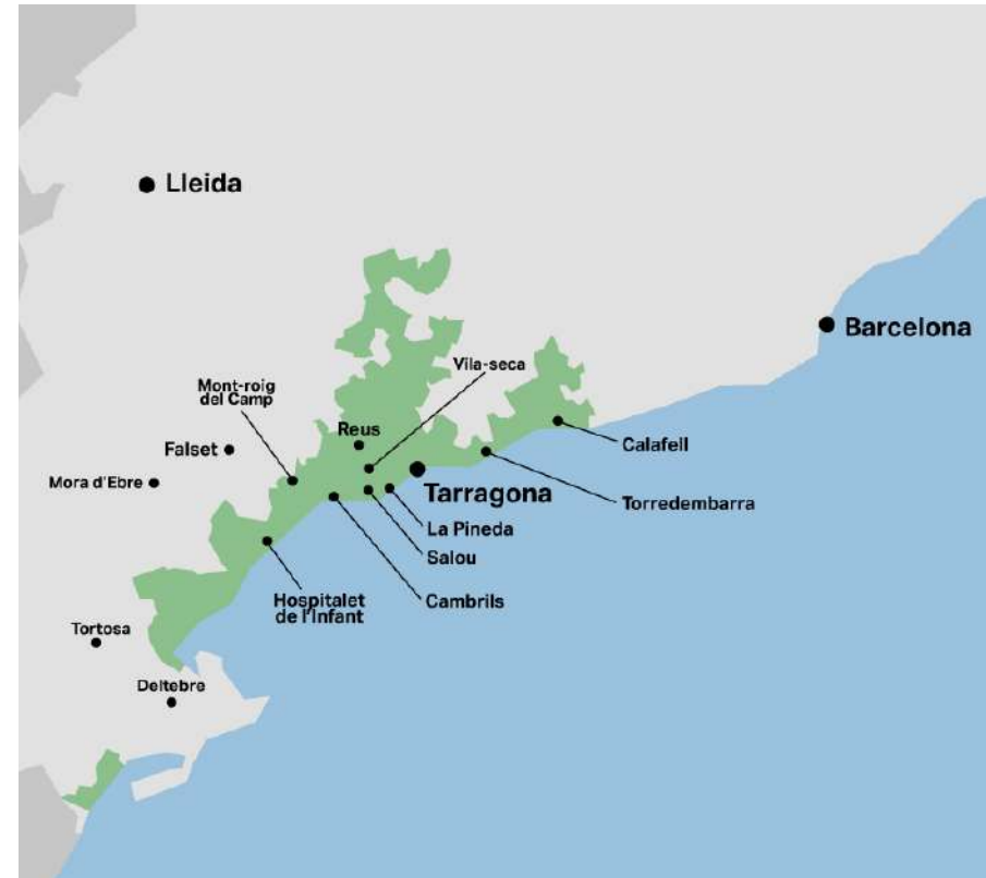
Stand der Dürre an der Costa Daurada und in den Terres de l'Ebre. Datum: Februar 2024

Weitere Informationen auf der Website der katalanischen Wasserbehörde: sequera.gencat.cat